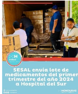
SESAL envía lote de medicamentos del primer trimestre del año 2024 a Hospital del Sur

Como parte de su programa de responsabilidad social la Fundación Para el Desarrollo del Sur (FUNDESUR) brazo social de la industria camaronera realizó una donación de medicamentos al Hospital General del Sur.