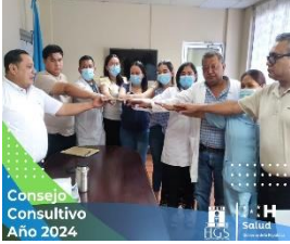
Consejo Consultivo Año 2024

A principio del mes de enero se eligió el nuevo Consejo Consultivo correspondiente al año 2024, en la cual los miembros decidirán lo mejor para el Hospital del Sur.