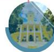
Jefes de Servicios y Areas