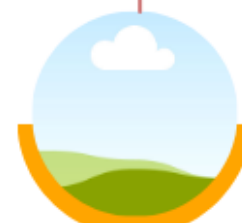
Espera Nombramiento Epidemiología