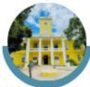
Unidades de Apoyo Clínico